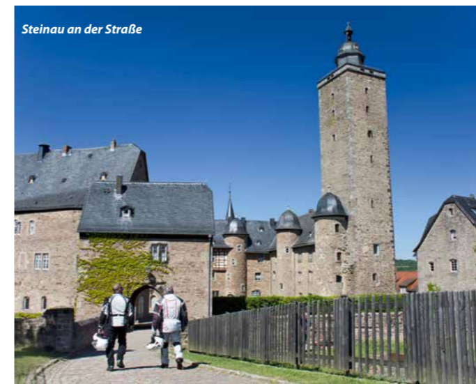
Steinau an der Straße

Mit Schotten im Vogelsberg liegt eine Stadt auf dieser Runde, die jährlich im August zum Mekka der Fans historischer Bikes und Rennen wird – beim Schottenring Historic Grand Prix. Nicht nur dann sind unsere Fachwerkziele einen Besuch wert, denn TOUR 4 liefert mit Grünberg, Homberg (Ohm), Alsfeld und der Märchenstadt Steinau an der Straße Fachwerk vom Feinsten, verbunden durch fabelhaften Motorradgenuss.