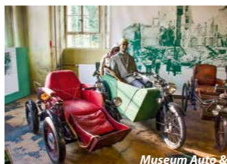
Museum Auto &